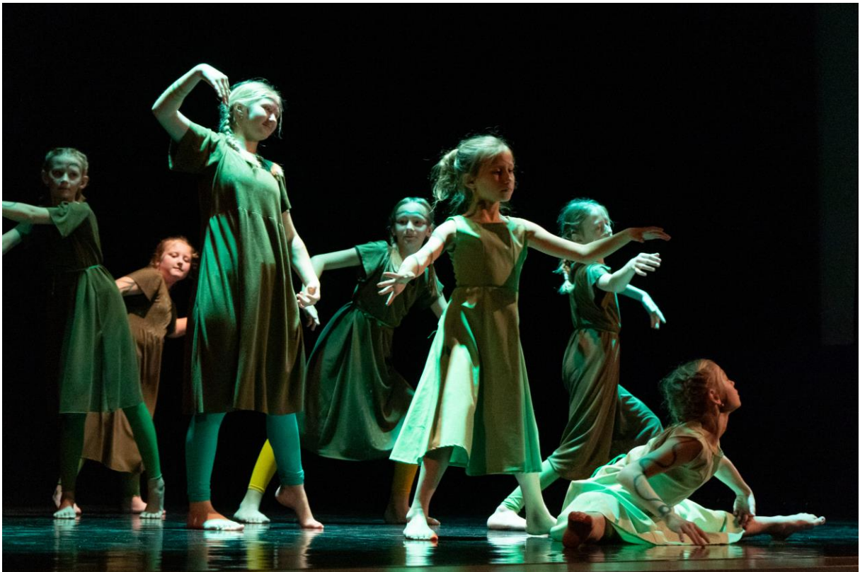
Z vystoupení tanečního oboru v programech pro veřejnost: Vánoční pohlázení a Tanec v srdci.